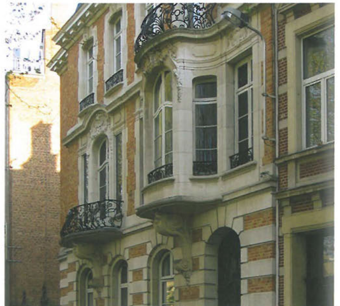
Eén van de plannen en de foto van de gevel van Delen - Private Bank te Gent