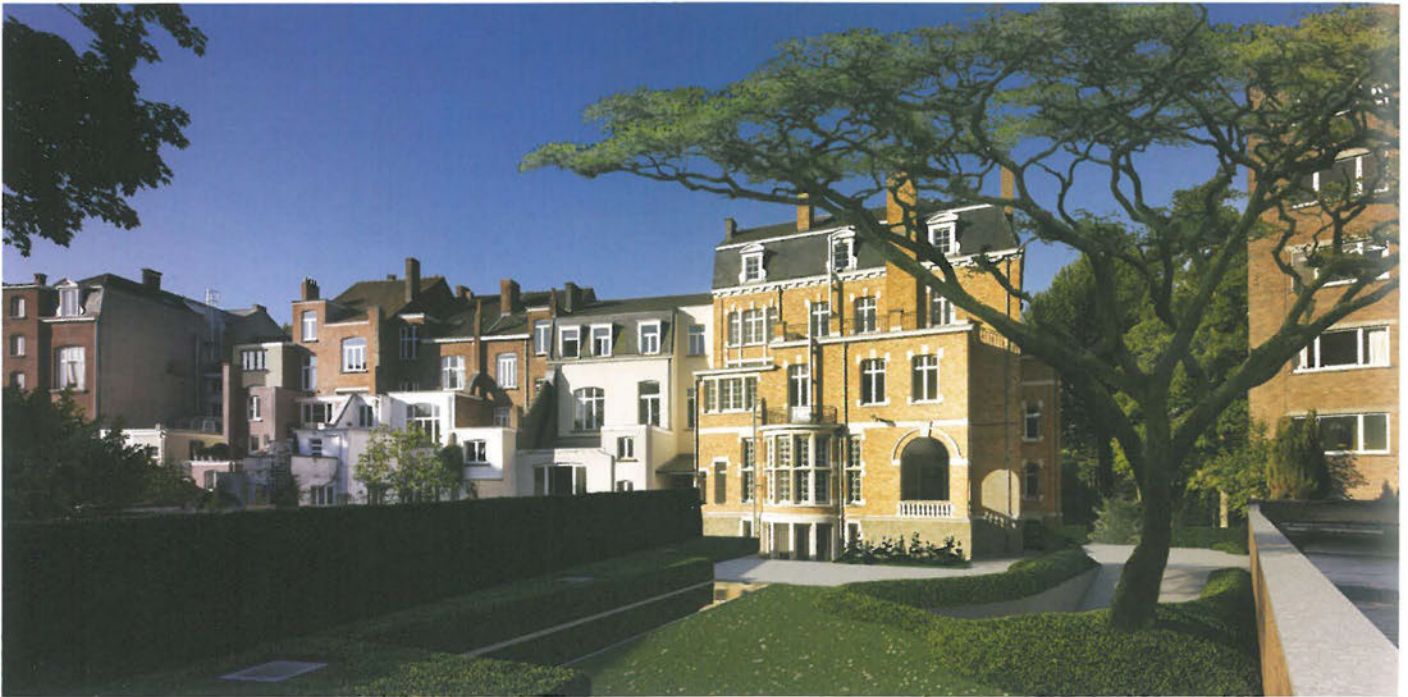
3D plannen van de achtergevel van Delen - Private Bank - Gent na de verbouwing